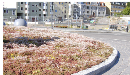
Mos-sedum matte i rundkørsel