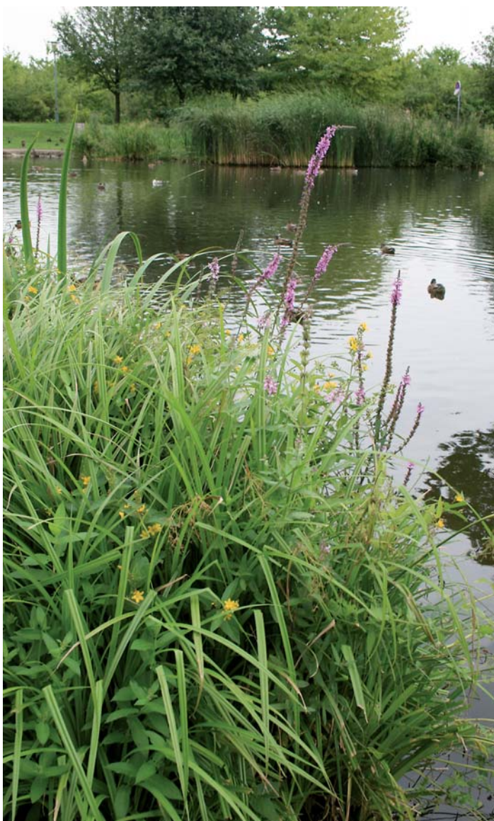
Bredrullebeplantning i Valbyparken anlagt 2007, ingen pleje. Skovkogleaks dominerer, men de er også bl.a. gul iris, kattehale og alm. fredløs.

Den landskabsbaserede afvanding - eller lokal afledning af regnvand - i byerne vinder frem, men er stadig på et relativt eksperimenterende stadie. Tidligere er regnvandsdamme primært blevet etableret som tekniske anlæg med hegn og stejle skråninger. I dag etableres langt flere anlæg i urbane sammenhænge.