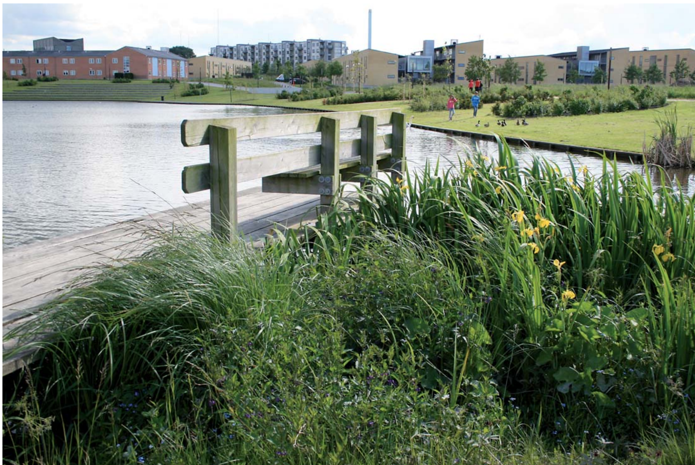
Rekreativ, oplevelsesrig bredbeplantning ved Trekronersøen, Roskilde. Veg Tech Bredmåttebeplantning etableret oktober 2005. Gul iris, nikkende star, skovkogleaks, bittersød natskygge, vandmynte, engkabelleje og eng-forglemmigej.

detimer i forhold til udplantning og den efterfølgende pleje.