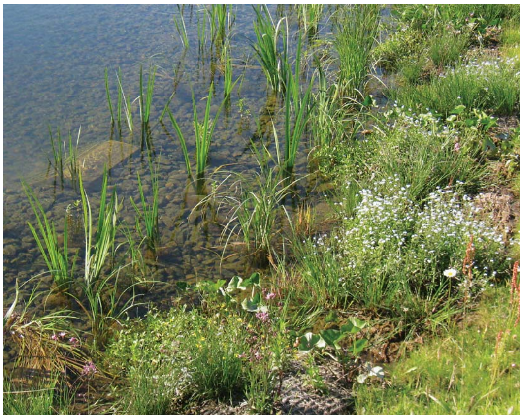
Nyetableret bredmåtte med lave arter, bl.a. eng-forglemmigej. Kokosvævet ses her først på sæsonen da beplantningen endnu ikke slutter tæt.

vandet vil afspejle omgivelserne. Derfor er det vigtigt at vælge beplantningen ud fra de oplandets jordforhold.