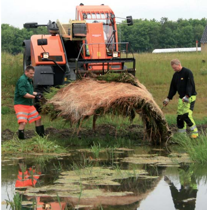
Udplantning af bredmætter i nyt boligområde ved Lindholt, Randers, juni 2010. Planterne er dyrket i kokosmætter og havde ved udplantning et tæt, sammenhængende rodnet. Det giver hurtig og nem etablering.