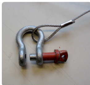
Detaljebillede af Sjækkel

FOS 40 wiren er 20cm FOS 68 wiren er 30cm FOS 88 wiren er 50cm